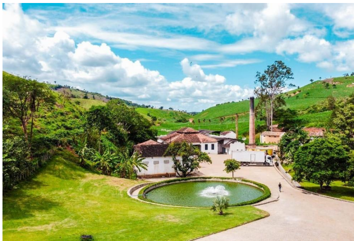
Engenho Vaca Brava, em Areia, na Paraíba